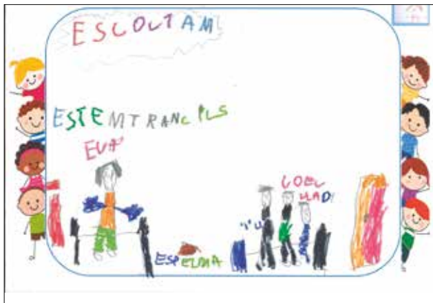
Imatge 4. Dibuix de valoració del projecte Escolta'm per part d'un alumne d'educació infantil

primeres oportunitats de crear vincle entre l'alumnat entre si i entre l'alumnat i la tutoria de grup.