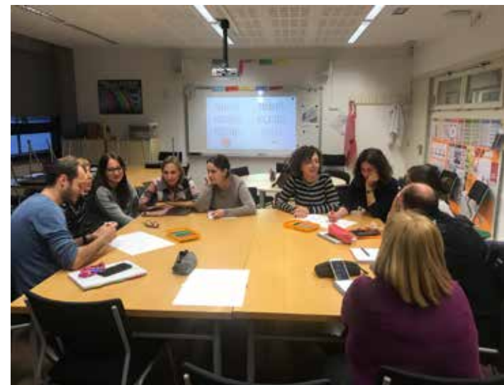
Imatge 3. Sessió de formació del claustre de mestres

El professorat vam continuar amb la formació i l'acompanyament dels referents de centre i amb