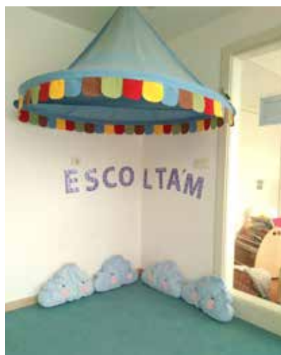
Imatge 2. Espais Escolta'm . A l'esquerra, l'espai d'infantil. A la dreta, l'espai de primària