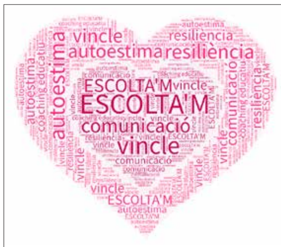
Imatge 1. Núvol d'etiquetes sobre els fonaments del projecte Escolta'm de l'escola

materials que ens permetessin crear uns espais càlids, relaxants i personals i la participació en el seminari de referents de centres del projecte Escolta'm a les Terres de Lleida, coordinat pel CRP Segrià (imatge 2).